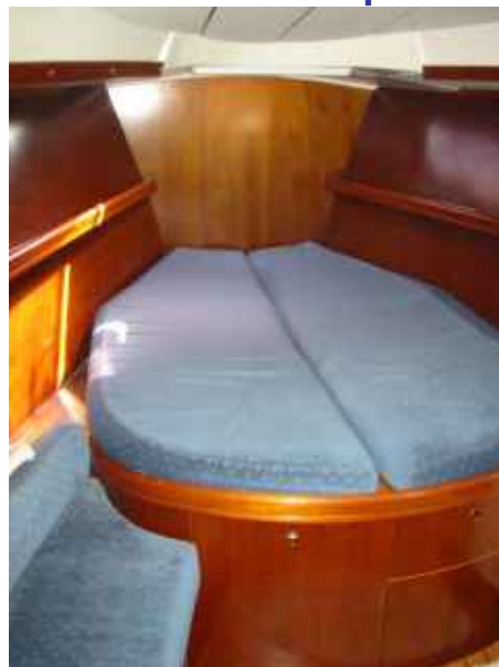
Chambre avant très spacieuse