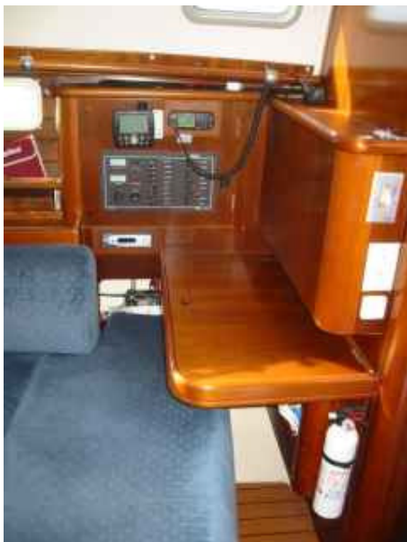
Table à carte