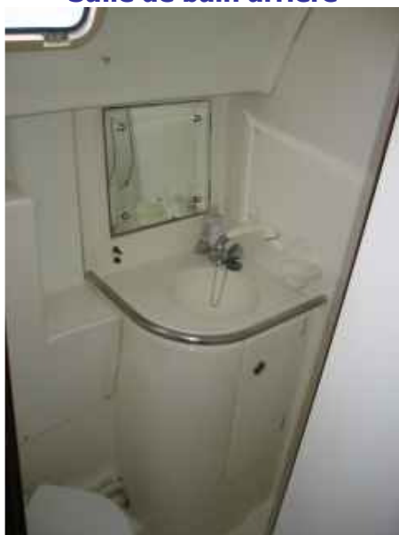
Salle de bain arrière