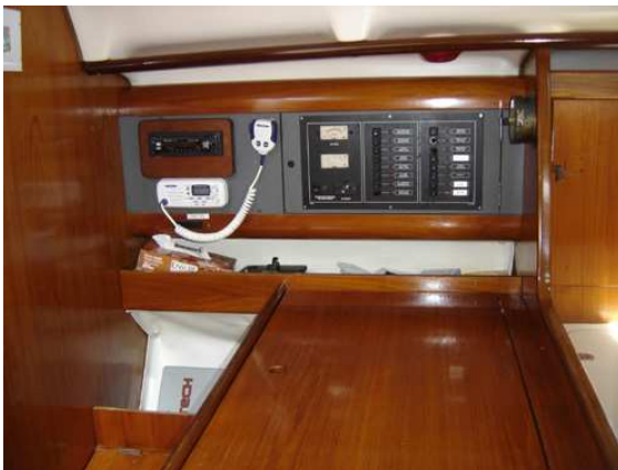
Table à carte bien accessible et complète avec beaucoup de rangement pratique. Panneau avec disjoncteur 12 volts et 120 volts. Nouveau chartplotter Garmin couleur ainsi que radio am-fm compatible Ipod

Intérieur: 3 chambres à coucher double, chambres arrière très bien ventilé par 3 écoutilles / chambre, eau pression chaude (échangeur et 120V) & froide; cuisinière ENO 2 ronds avec fourneau; grande salle de bain avec douche;