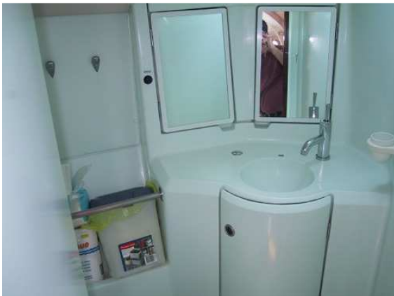
Grande salle de bain avec eau sous pression et eau chaude, possibilité d'y installer une douche. Système de récupération d'eau en place avec système de pompe 12 volt.