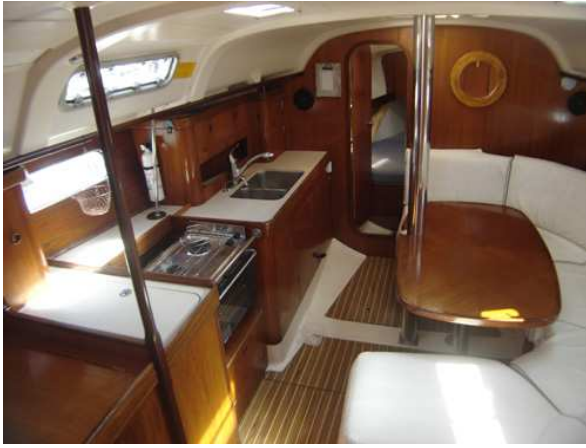
Cuisine avec cuisinière Eno 2 ronds et fourneaux sur cardan. Frigidaire avec compresseur Frigoboat, évier double