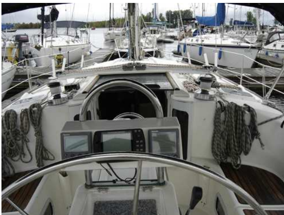
Grand cockpit avec table en permanence incluant un rangement. Contrôle des manettes à gaz, cadran moteur et équipements tel le profondimètre, lock sont faciles d'accès à la barre à roue.